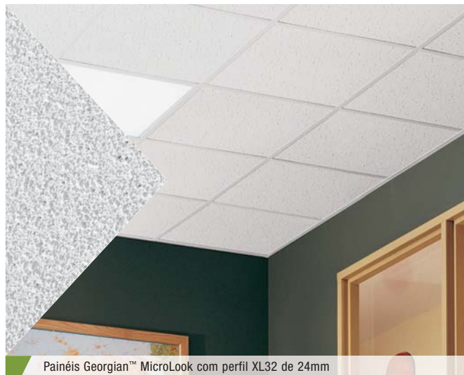
Painéis Georgian™ MicroLook com perfil XL32 de 24mm

O forro Georgian é econômico, com textura fina e tem boa resistência à impactos e arranhões